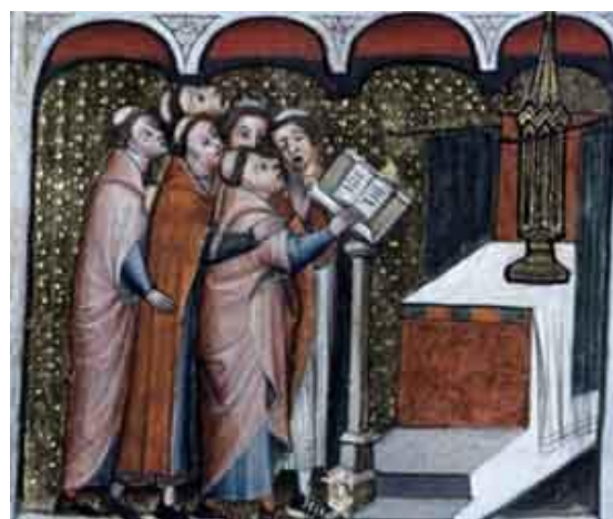
Manuscrit Fr 152, f° 187v, Chantres au lutrin, BnF

On entend un _____. On peut en déduire que ces personnes chantent dans un lieu de grande taille et aux parois dures : église ou cathédrale .