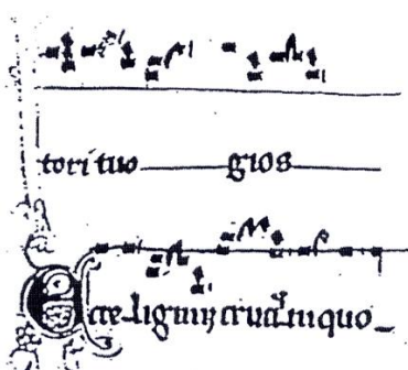
← Extrait du Processional de l'Abbaye de Silos (XIV ème siècle)