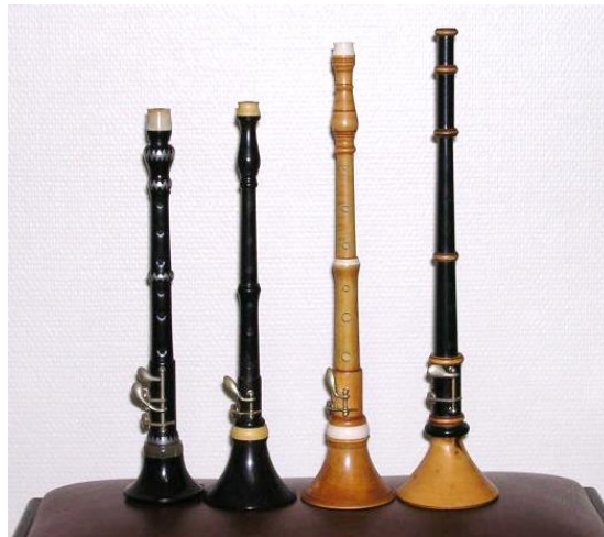
Collections de quatre bombardes sans leur anche.

Le joueur de bombarde s'appelle le : talabarder .