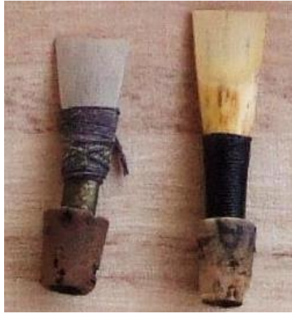
Anche double de bombarde.

Le biniou kozh (« biniou ancien ») est très ancien en Bretagne. Sa forme et ses dimensions ont changé au cours du temps. Le biniou se compose d'un réservoir de cuir ( sac'h ) alimenté par un petit tuyau ( sutell ) permettant au préalable de le gonfler. Ce sac, placé sous l'aisselle gauche du sonneur laisse échapper, sous la pression du bras contre les côtes, l'air qu'il contient par deux autres tuyaux : d'une part le chalumeau ( levriad ) à anche double, percé de six trous offrant la possibilité de jouer une octave de notes selon un doigté voisin de celui de la bombarde, et d'autre part, le bourdon ( c'horn-boud ) à anche simple, qui fait entendre un son grave, continu et invariable correspondant à ce que l'on appelle une pédale de tonique en harmonique.