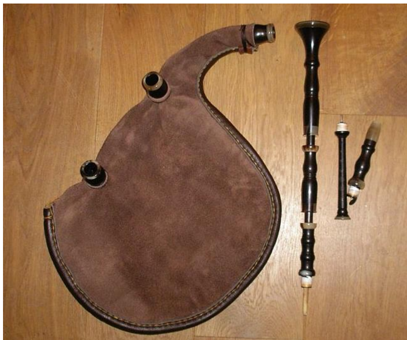
Biniou Kozh démonté

Cet instrument est joué en couple avec la bombarde dans les danses traditionnelles par le biniawer .