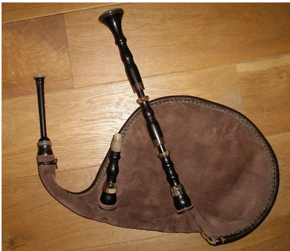
Biniou Kozh monté.