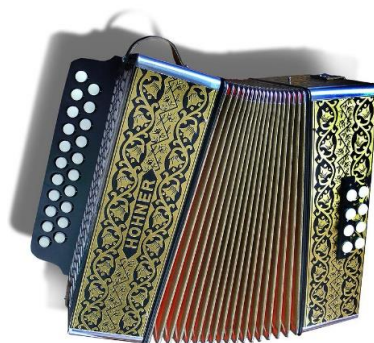
Accordéon diatonique neuf de marque Hohner.

Dans un accordéon bi-sonore, chaque touche produit deux notes différentes produites par deux anches montées sur un même sommier, suivant le sens d'action du soufflet (poussé ou tiré).