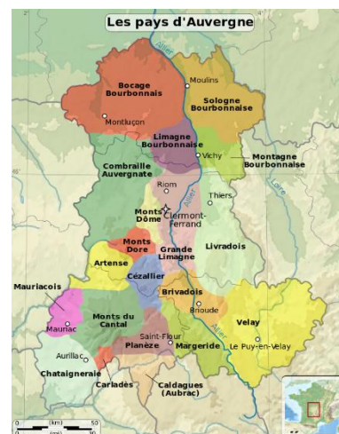
Carte des 4 départements et des 20 pays auvergnats.