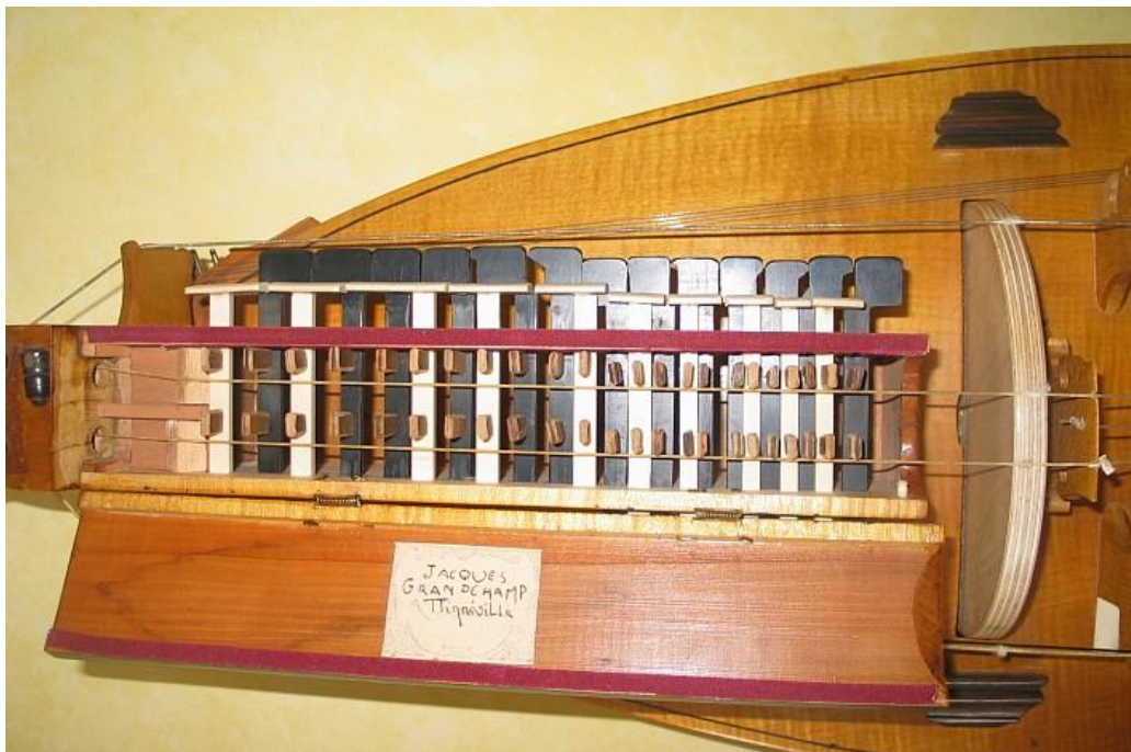
Vielle à roue : Mécanisme de la vielle