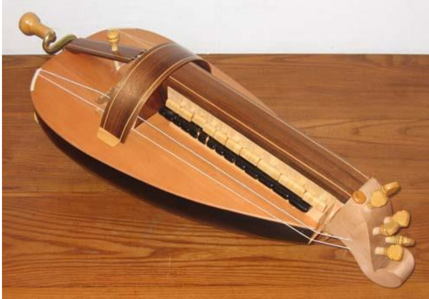
Vielle à roue.

Parmi les bourdons, une corde particulière donne cette caractéristique originale de la vielle qui est de pouvoir rythmer une mélodie. Cette corde ne passe pas sur un chevalet fixe, mais repose sur une petite pièce de bois appelée le « chien », elle-même maintenue sur la table d'harmonie par la pression de la corde. Lorsque cette corde vibre suffisamment, la pièce de bois vibre alors sur la table, et génère un son comparable à un grésillement. L'instrumentiste produit cette vibration par une frappe de la manivelle, que l'on appelle détaché ou « coup de poignet ».