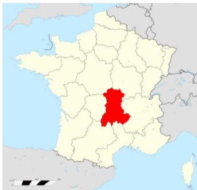
Carte de France mettant en évidence la région Auvergne.

Bressuire est distant d'environ 400km de Clermont-Ferrand.