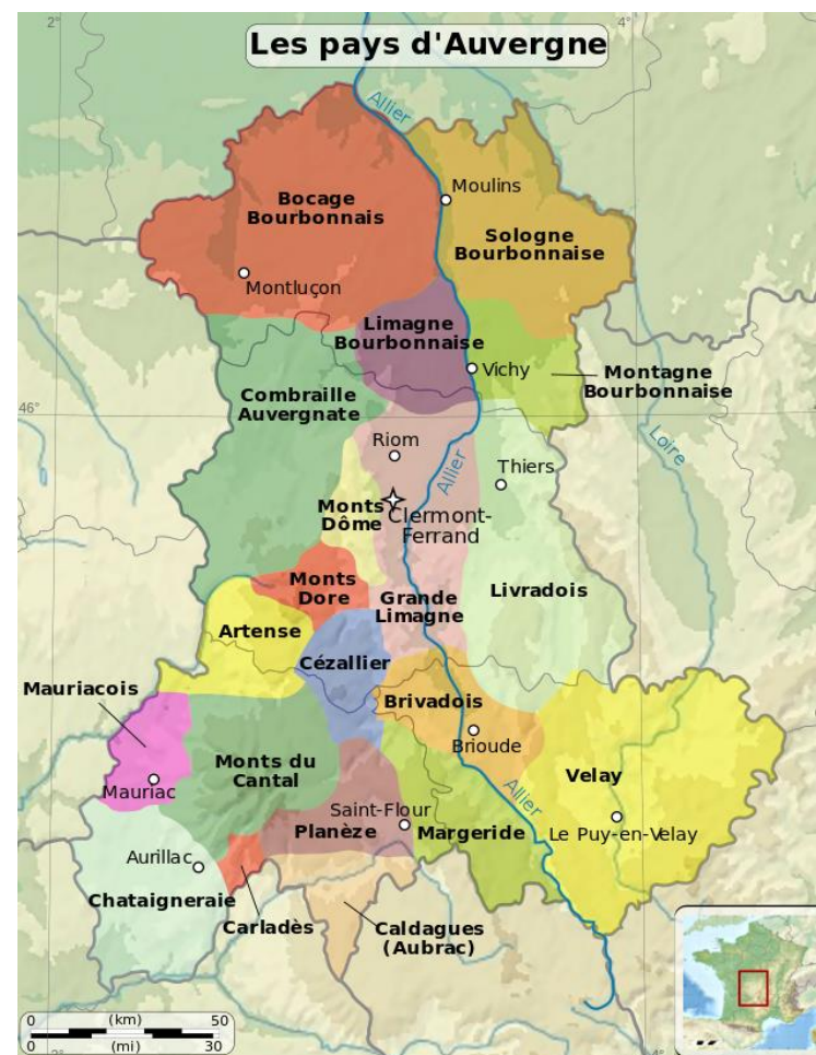
Carte des 4 départements et des 20 pays auvergnats.

_____ km entre _____ et Clermont-Ferrand.