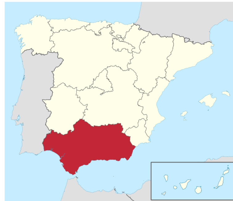
Carte de l'Espagne. En rouge, l'Andalousie, berceau du Flamenco.

_____ est situé à environ _____ km de Séville, la plus importante ville d'Andalousie