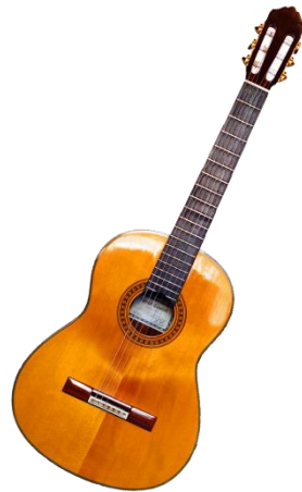
Exemple de guitare classique.

La guitare est un instrument à cordes pincées. On appuie les cordes d'une main, pour produire des notes différentes. L'autre main pince les cordes, soit avec les ongles et le bout des doigts, soit avec un « outil » ( mediator ). Sa variante la plus commune a six cordes.