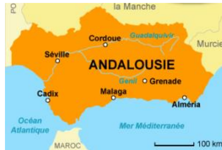
Carte de l'Andalousie (région espagnole) et de ses principales villes.