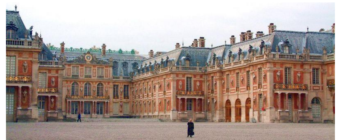
Château de Louis XII. Partie la plus ancienne de Versailles.