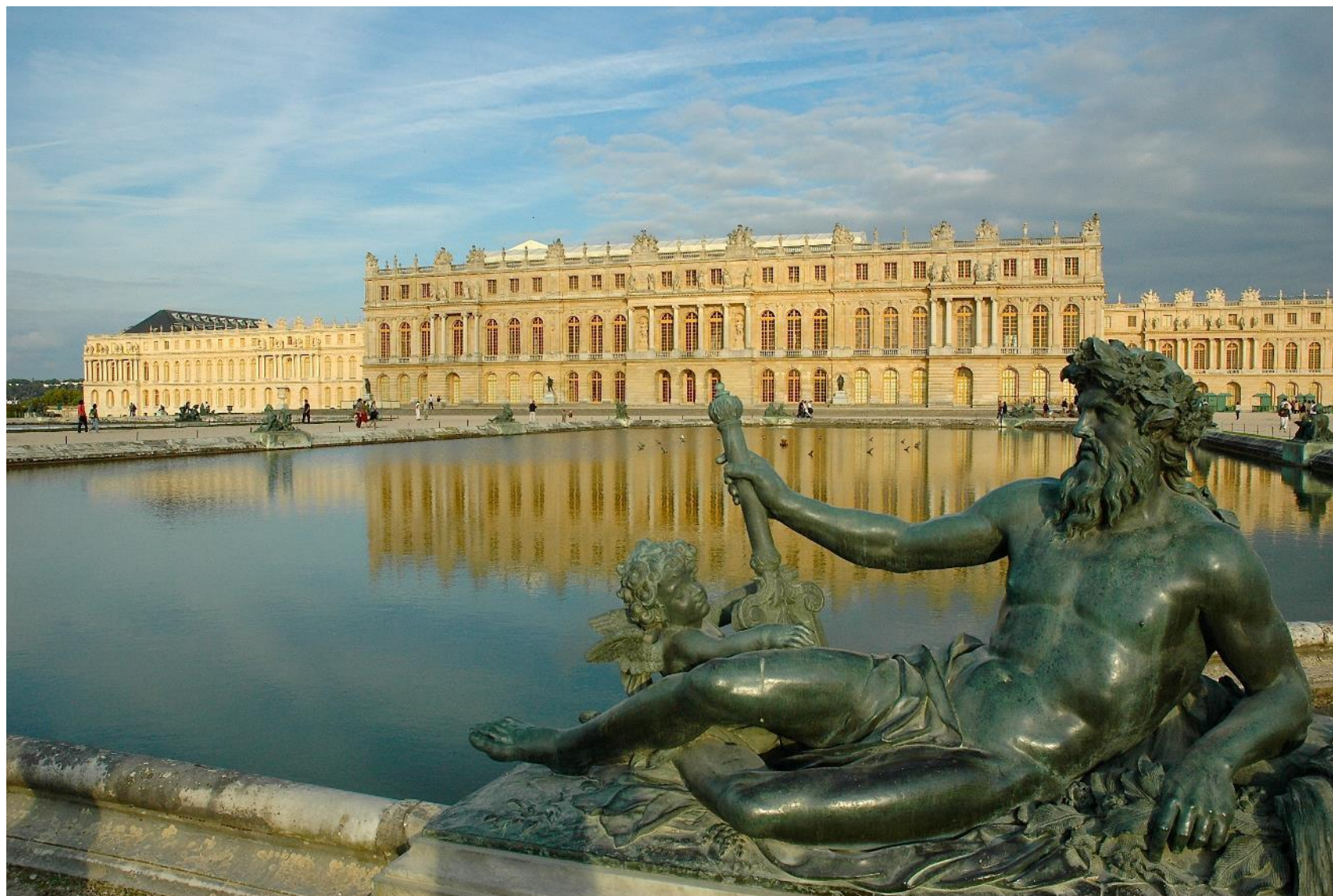
Façade ouest (sur le parc), Œuvre de Le Vau et Mansart.

Il y a eu plus de 8000ha avant la révolution Française. Il en reste maintenant 815 ha. Dans ces jardins, on retrouve, pour les nommer, le Petit et le Grand Trianon (qui fut la résidence de plusieurs monarques), le hameau de la Reine, une orangerie et la pièce d'eau des Suisses).