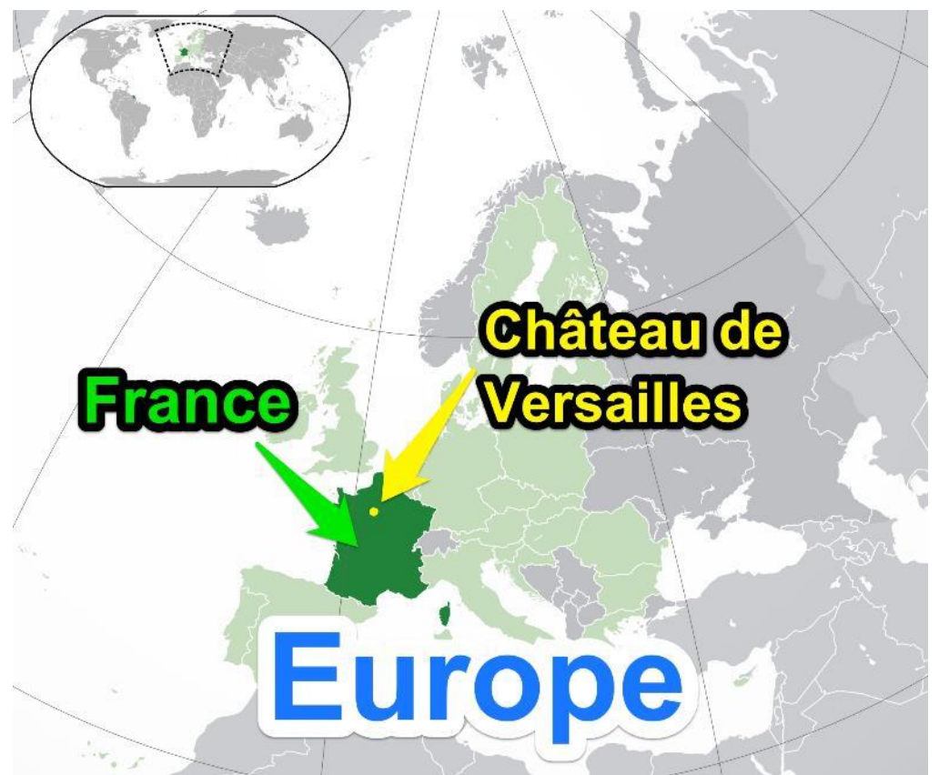
Carte de l'Europe avec France et Versailles.