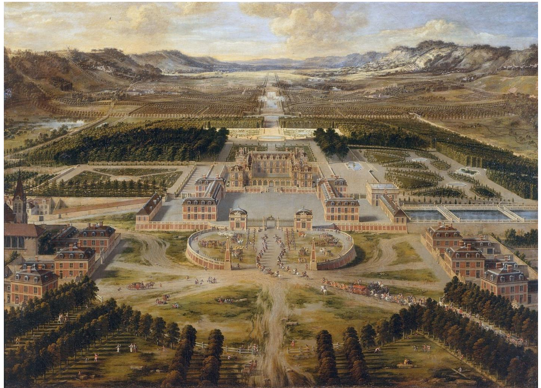
Le château après le premier agrandissement de 1668

Le nouveau Versailles est très grand. Il a été construit en plusieurs étapes. Il y a eu d'abord l'enveloppe centrale, puis la Galeries des Glaces (dans l'aile Sud)