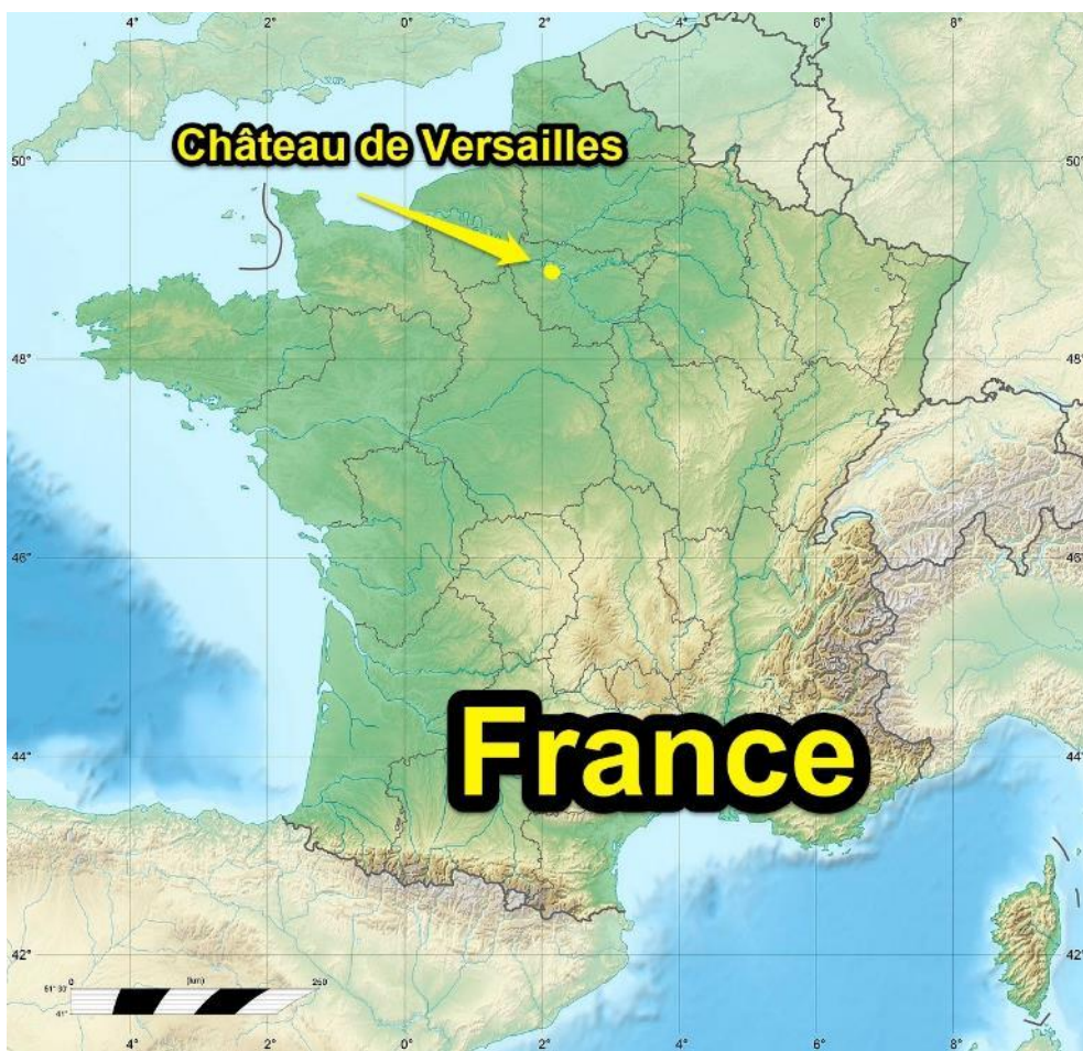
Carte de France et position de Versailles.