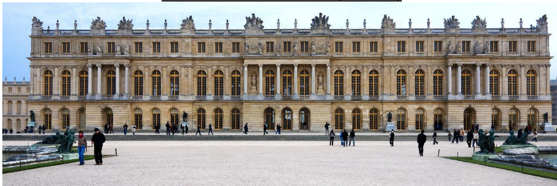
Vue actuelle de la façade Ouest avec la galerie des Glaces.

Il y a de nombreux autres bâtiments qui seront construits à Versailles.