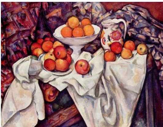
1. Nature-morte aux pommes et aux oranges, Paul Cézanne (1895-1900) //

http://fr.wikipedia.org/wiki/Nature_morte#mediaviewer/Fichier:Paul_C%C3%A9zanne_179.jpg