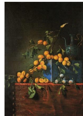
7. Dupuis-Prunes-Agen Domaine public // Pierre Dupuis —