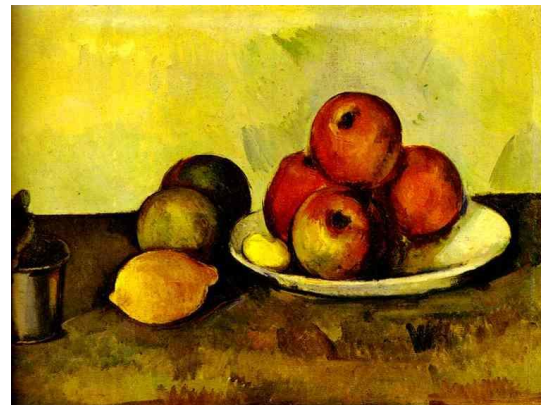
1bis. Paul Cézanne, Still Life with Apples // c. 1890 (110 Kb); Oil on canvas; The Hermitage, St. Petersburg

http://fr.wikipedia.org/wiki/Nature_morte#mediaviewer/Fichier:Paul_C%C3%A9zanne_179.jpg