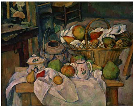
4. Paul Cézanne, Still Life With a Basket (Kitchen Table) // c. 1890-95; Musée d'Orsay, Paris