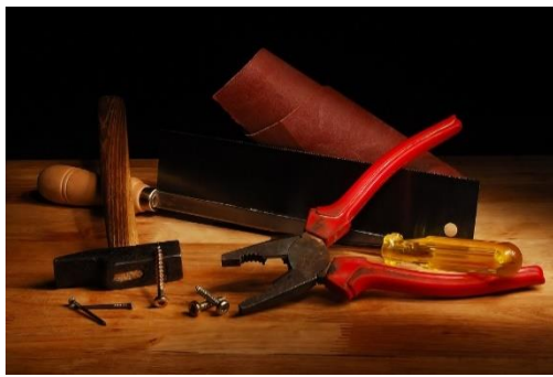
3. Stefano Paolini