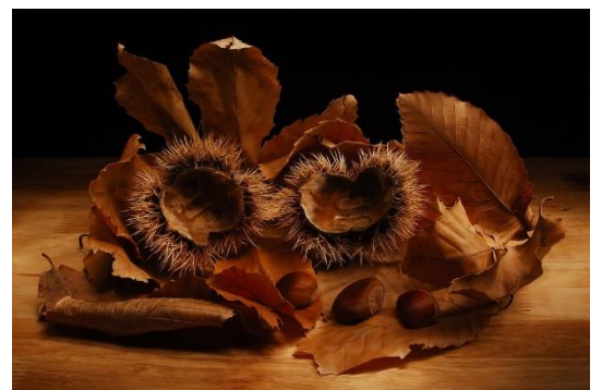
2. Stefano Paolini