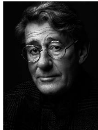
Portrait d'Helmut Newton.

Helmut Newton est jeune lorsqu'il commence la photographie : dès ses 16 ans, en 1936. Il quitte l'Allemagne dès 1938 pour l'Australie où il participera à la 2 nd e guerre mondiale en travaillant à la logistique. Après 1948, il travaillera comme photographe de mode. A partir de 1961, il s'installe en France et se consacre exclusivement à la photo de mode. A partir de 1981, il quitte la France pour Los Angeles (USA) et Monaco.