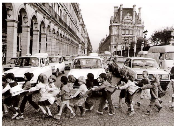
1978, Les tabliers de la rue de Rivoli.

Cette deuxième photo nous fait voir des élèves de grande section / CP qui traversent une rue de Paris. Ils se tiennent tous par leur manteau. Le fond est composé par les voitures qui laissent passer les enfants et par des arcades (à gauche) et un immeuble à droite.