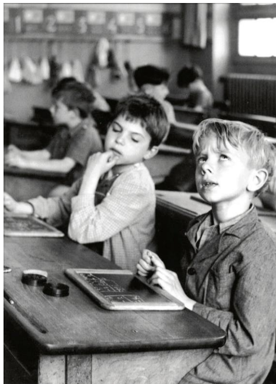
1959, Ecole, rue Buffon.

La première photo a été prise en 1959, à Paris. Elle se compose de trois plans. Au premier plan, on a le garçon blond qui regarde en l'air avec son ardoise et son bureau. Le deuxième plan est constitué de son voisin. Il y a un fond qui est formé du reste de la classe et des autres élèves.