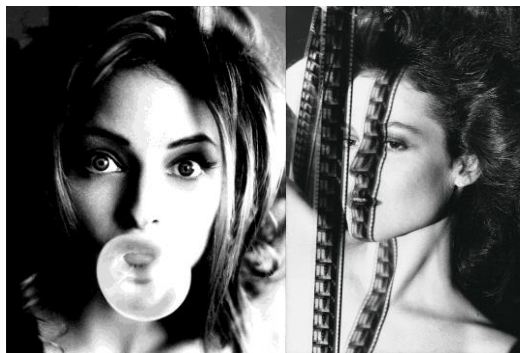
1.Jodie Foster // 2.Sigourney Weaver

La seconde image montre une jeune fille qui quitte Barcelone en 1938. Elle est bien sûr le sujet de l'image, nette. Le fond est flou formé des objets autour d'elle.