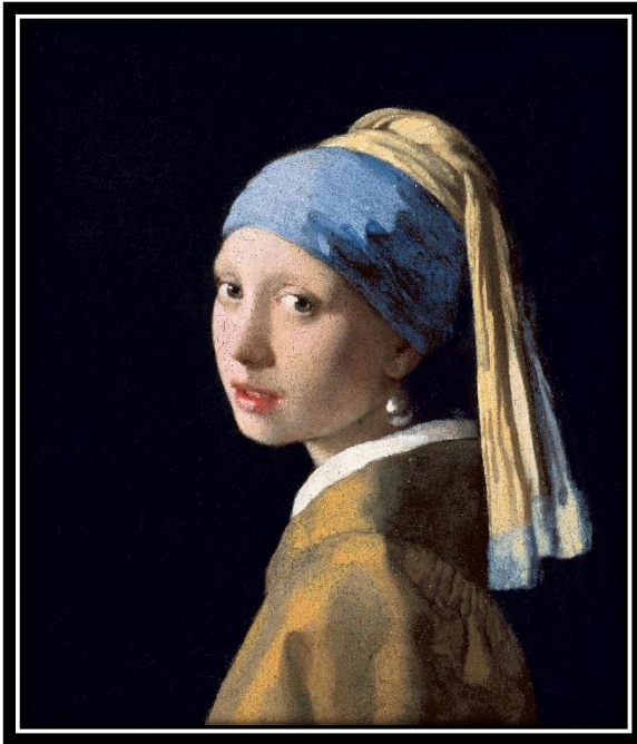
Jeune fille à la perle – 1665 Huile sur toile | 45,5 cm x 39 cm

Ce tableau, La jeune fille à la perle, est un portrait en buste d'une jeune femme. Peut-être une des filles de Vermeer ? Il rappelle La Joconde de Leonard De Vinci .