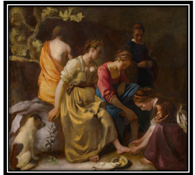
Diane et ses compagnes – 1655 à 1656 Huile sur toile | 97,8 x 104,6 cm

Cette seconde œuvre représente une scène mythologique. On y voit Diane, une déesse des romains, accompagnée de ses nymphes. Vermeer s'est inspiré de Rembrandt pour représenter ces dernières. C'est une des rares toiles mythologiques ou religieuses de cet artiste.