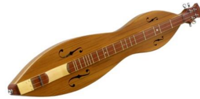
Photo d'un dulcimer des Appalaches

Ce premier morceau nous fait entendre un ensemble instrumental avec des ____1____, hommes et femmes. De nombreux instruments se font entendre dont : la cabrette (une cornemuse), l'accordéon (chromatique et diatonique), la vièle à roue, le violon, le dulcimer... On reconnaît un ____2____ continu qui accompagne une mélodie (vièle). Les autres instruments rentrent ensuite. Lorsque les chanteurs se font entendre, les instruments se taisent sauf la ____3____ et les bourdons. Cet ensemble utilise également l'épinette.