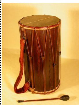
Photo d'un tambourin

Le tambourin est un instrument à percussion à peau. Sur la peau supérieure (en chèvre) est tendue une ____6____. Elle donne un son un peu nasillard à l'instrument. La peau est frappée avec une baguette lestée.