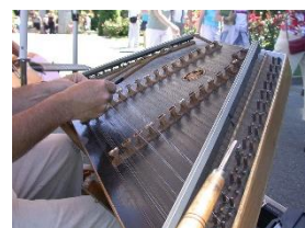
Dulcimer (du moyen-âge)

JE RETIENS : La musique d'Alsace est un mélange de cultures : Française, Suisse et Allemande.